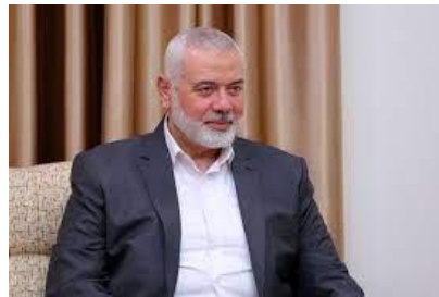
Ismail Haniyeh, jefe de Hamás que planeó el ataque mortal contra Israel

Hamas opera en dos niveles principales: como una organización política que participa en elecciones y como un ala militar que lleva a cabo operaciones armadas.